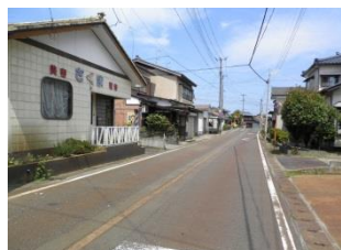
⑥ 出世稲荷神社～踏み切りまでの道。幅が狭く交通量が多い。特に夕方は危険険。