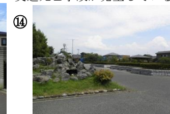
⑭ 南公園東屋付近。道路からの見通しが悪い。不審者事案が多い。