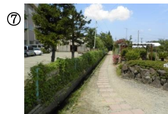
⑦ 農業高校実習園内の道。人通りが少ない。