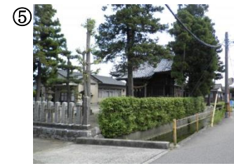
⑤ 東町公会堂 天照皇太神宮付近。人通りが少ない。川に落ちないように注意。