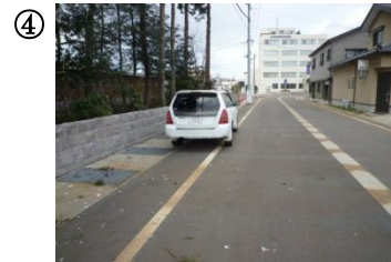
④ 諏訪神社、東公園周辺。人通りが少ない。車に引きずり込まれる恐れ有り。