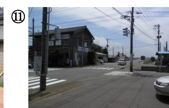
⑪ たわら屋前交差点及び、俵屋～住吉町へ抜ける道。交通量が多く、交通死亡事故が発生している。