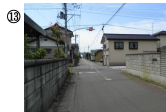
⑬ 大栄町5丁目点滅信号交差点。見通しが悪い上に交通量が多い。交通事故が多い。