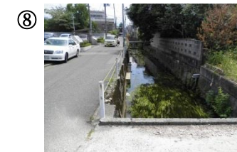
⑧ 富樫医院付近の十字。道幅が狭く一時不停止車が多い。新発田川周辺は転落の危険。