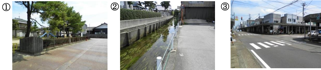
① 中央公園の周辺。街灯が少なく、人通りも少ない。