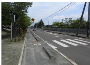
⑫ 南公園周辺道路、四つ角の交差点やT字路。飛び出しによる交通事故が多い。