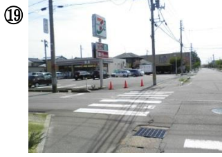
19 御幸町 4 丁目セブンイレブン前交差点。4 方向の交通量が多いにもかかわらず、点滅信号のみ。左右の安全確認と車の停止を確認してから横断する必要がある。また、横断を待っている時の、巻き込みにも注意する。