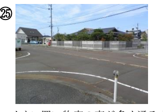
25 イオン買い物客の車がよく通る交差点。交通量が多く横断が危険な時がある。横断歩道を使う。