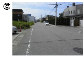
22 イオン～アミーゴ裏通り。イオンの買い物客の車がよく通る。自転車の飛び出し事故があった。