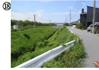
18 荒町竹園用水路・調整池。柵やガードレールを越えると滑りやすく大変危険。高架橋下(18-1, 18-2)は死角になりやすい。