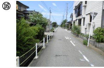
16 大栄町 5 丁目住宅街。道が狭く、見通しの悪い十字路が多い。飛び出しに注意。夕方は暗く、人通りも少ない。