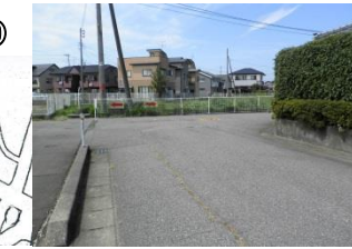
20 御幸町 4 丁目住宅街。見通しが悪い。夕方は街灯も少ない。飛び出し注意。