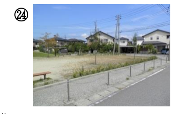
24 黒松公園付近。道路遊び、自転車の飛び出しによる交通事故に注意。