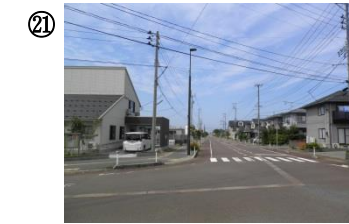
21 一中～サークル K の通り、ジャパンケア前交差点。車の通りが多い。小道からの飛び出しに注意。