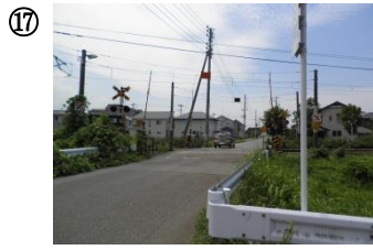
17 荒町竹園踏切。交通量が多い。警報音が鳴ったら横断しない。