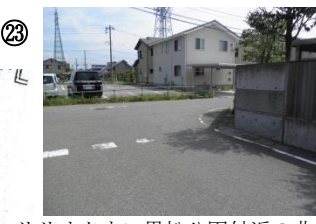
23 リリオタウン黒松公園付近の曲がり角。塀があるため見通しが悪い。自転車の飛び出し事故があった。