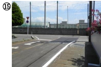
15 南公園～南高校 T 字路。街灯がなく暗い。飛び出しに注意。南高校裏の S 字の道路は見通しが悪く、道も狭い。交通事故に注意。